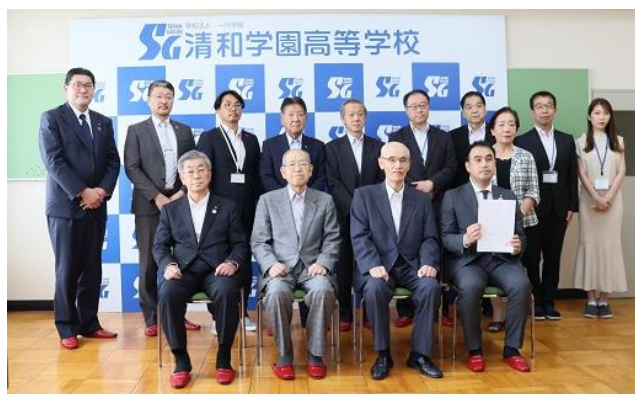
マイスター・ハイスクール運営委員会メンバー等