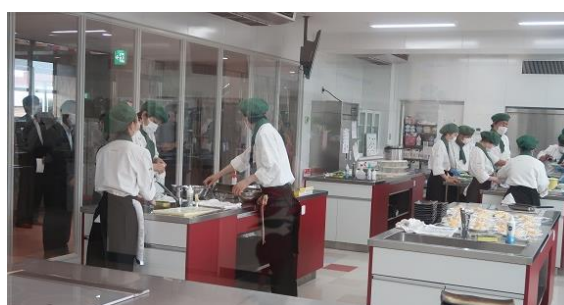
調理科の実習場を視察