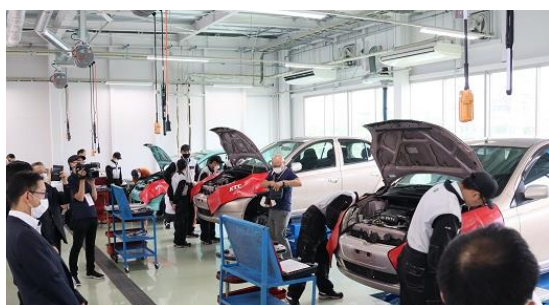
自動車科の実習場を視察